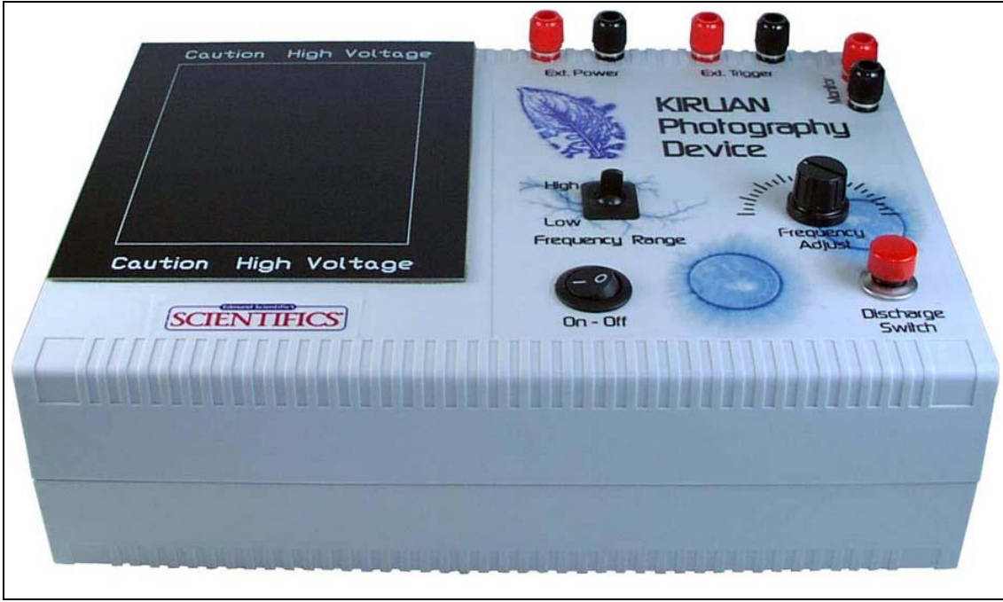
[ ] Resim-01: Kirlian Fotoğraf Makinası

[ ] http://sohbet.hanifislam.biz/link/kirlian_foto_makinasi.jpg