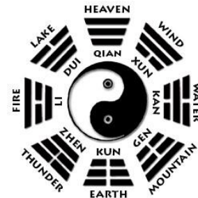
Şekil-002: Kore bayrağı ve 8 dallı sembol

Remil hep DÖRTLEMELERDİR . Danyal ss, der ki, "iri kum karıncalarını ince kumun üzerinde izliyordum, öyle düzenli bir trafikleri vardı ki, onlar çekilince yerdeki izlere baktım. Mucize gibiydi.